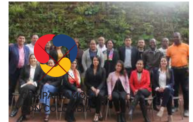
COMPARTAMOS CON COLOMBIA