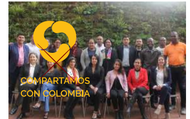
COMPARTAMOS CON COLOMBIA