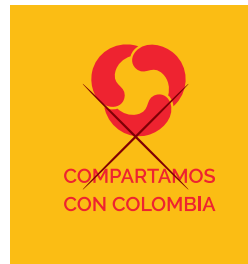
COMPARTAMOS CON COLOMBIA