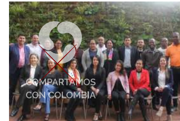
COMPARTAMOS CON COLOMBIA