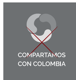
COMPARTAMOS CON COLOMBIA