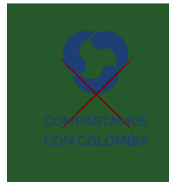
COMPARTAMOS CON COLOMBIA