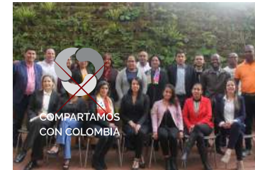
COMPARTAMOS CON COLOMBIA