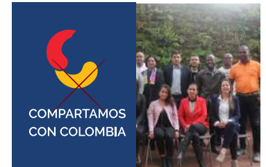
COMPARTAMOS CON COLOMBIA