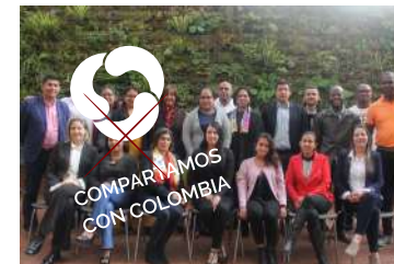
COMPARTAMOS CON COLOMBIA